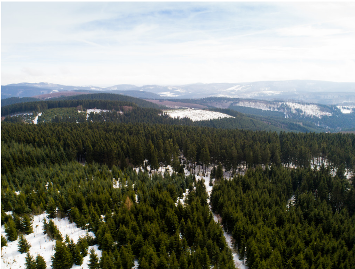
Blick vom Kahlen Asten in Winterberg (Sauerland) (2018).