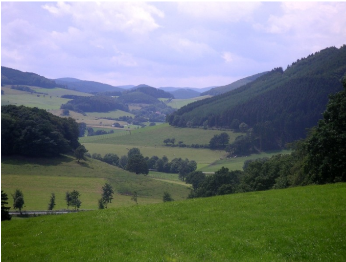
Das Sauerland bei Sundern-Altenhellefeld, Hochsauerlandkreis (2004).