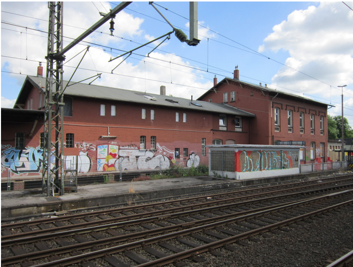
Das Empfangsgebäude (rechts) und links den Güterschuppen des Bahnhofes Gerresheim, von der Bahnseite aus gesehen (2012)