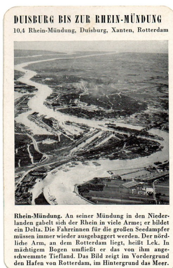
Spielkarte "Rhein-Mündung" mit einer Ansicht des Rheins bei Rotterdam (aus dem Quartettspiel "Der Rhein", Ravensburger Spiele Nr. 305, Otto Maier Verlag 1952).

Bundesland: Nordrhein-Westfalen , Rheinland-Pfalz