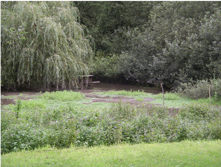
Strunderbach und Teich im Bereich der Quelle (2004)