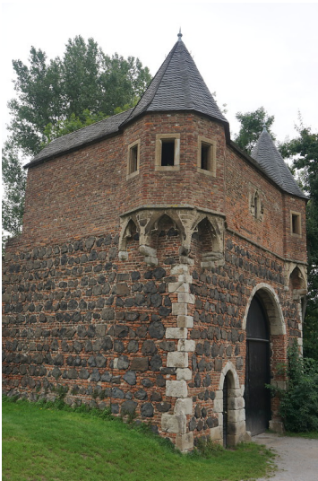
Stadtmauer Zons, Südtor (2017)