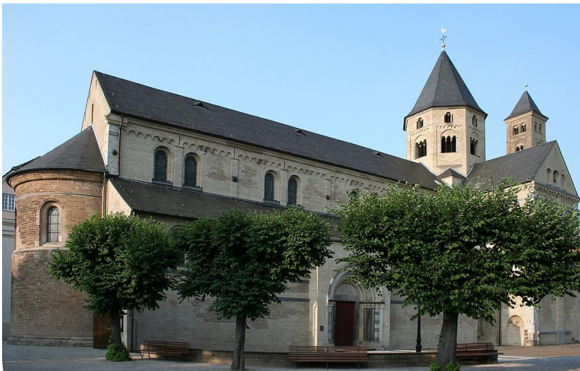
Ansicht der Südseite der Basilika der 1802 aufgehobenen Prämonstratenserabtei Knechtsteden bei Dormagen (2006).