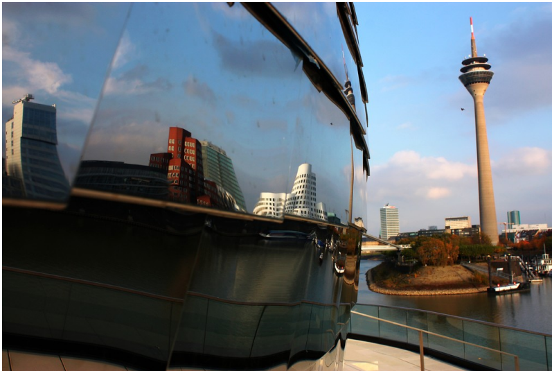
Sich in einer Glasfassade spiegelnde Gebäude im Bereich des Medienhafens Düsseldorf, rechts im Bild der 1978-1982 erbaute, 240,50 Meter Hohe Fernsehturm "Rheinturm" (2011)