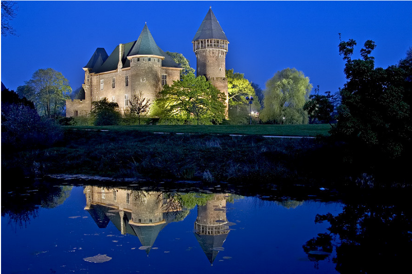
Die auf das 12. Jahrhundert zurückgehende Wasserburg Linn bei Krefeld bei Nacht; das Bauwerk spiegelt sich im bewässerten Burggraben (2005)