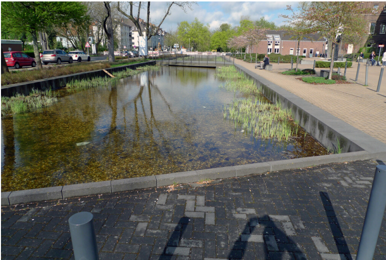
Nordkanal (2018)