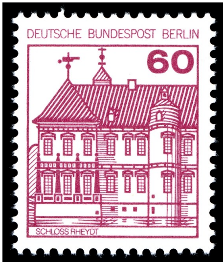
Schematische Darstellung von Schloss Rheydt auf einer Briefmarke der Dauermarkenserie "Burgen und Schlösser" der Deutschen Bundespost Berlin von 1979.