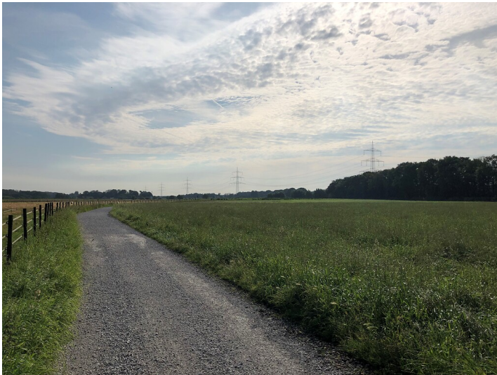
Bockerter Heide in Viersen (2021)