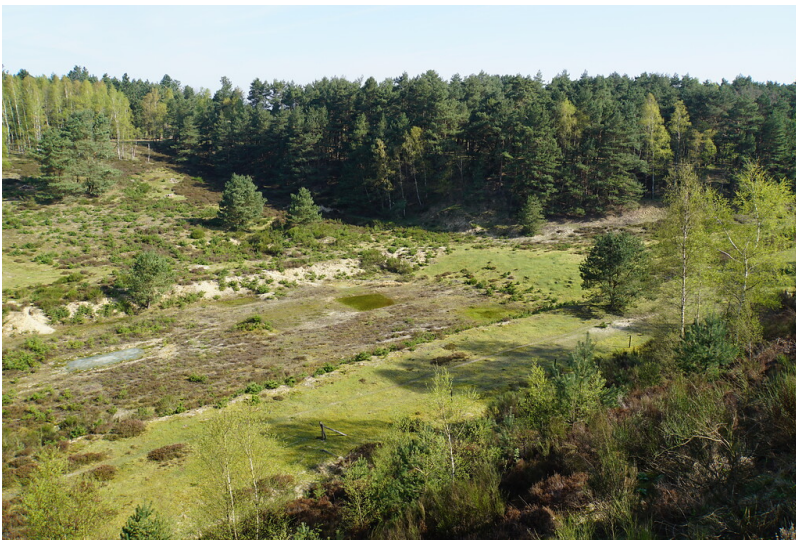
Ehemalige Sandgrube mit Heidelandschaft im Brachter Wald (2018)