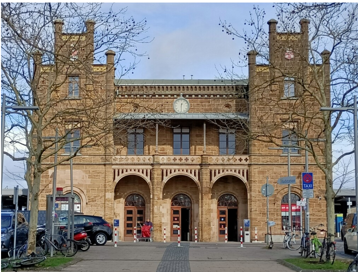
Bahnhof Minden, Empfangsgebäude (2026)