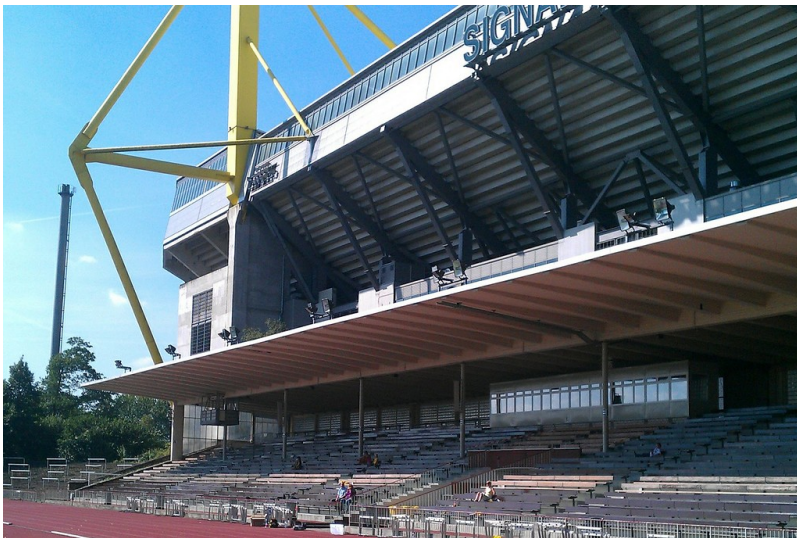
Tribüne des Stadions "Kampfbahn Rote Erde" vor dem heutigen Signal-Iduna-Park, dem ehemaligen Westfalenstadion in Dortmund (2011).