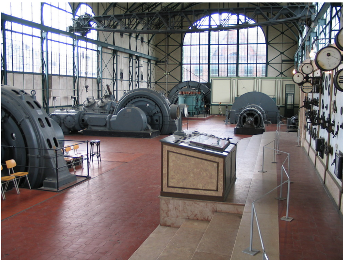
Kulturlandschaftsbereich Dortmund Zeche Zollern und Halde: Blick in die Maschinenhalle (2005).