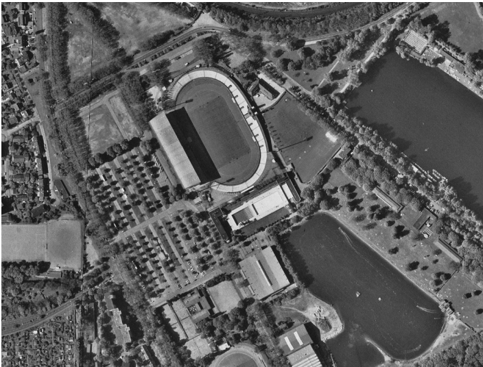
Luftbild (Digitales Orthophoto) aus dem Zeitraum 1988-1994: Der Sportpark Wedau mit dem Wedaustadion in Duisburg.