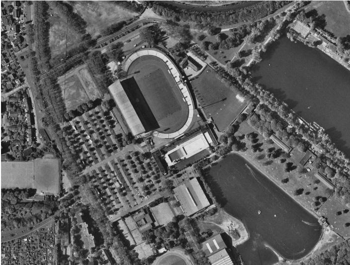
Luftbild (Digitales Orthophoto) aus dem Zeitraum 1988-1994: Der Sportpark Wedau mit dem Wedaustadion in Duisburg.