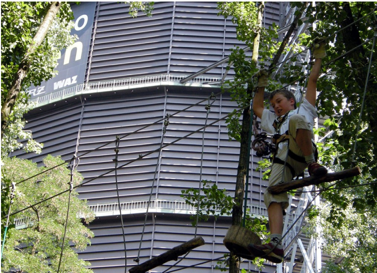
Gasometer Oberhausen, Teilansicht vom benachbarten Kletterpark aus (2009).