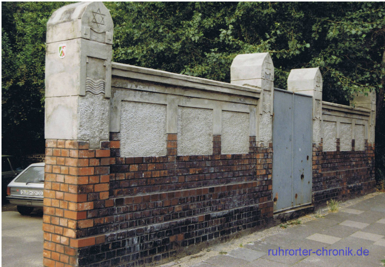
Die bis heute erhaltene Friedhofsmauer des früheren jüdischen Friedhofes in der Rheinbrückenstraße in Duisburg-Ruhrort (1974).