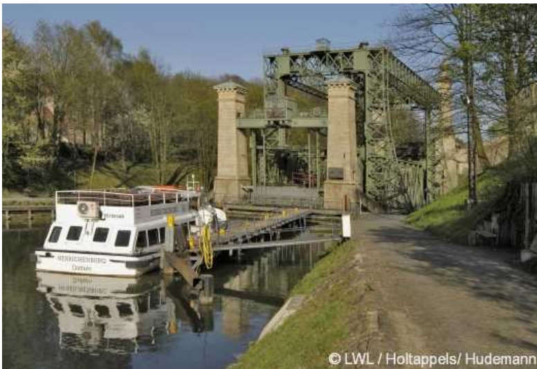
Schiffshebewerk Henrichenburg in Waltrop