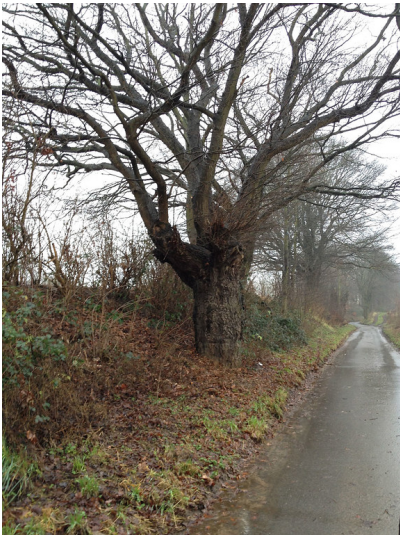
Kopfeiche am Vogtsweg in Rheurdt (2012)