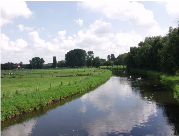
Die Niers bei mit beweideten Grünlandflächen am linken Ufer (2002)