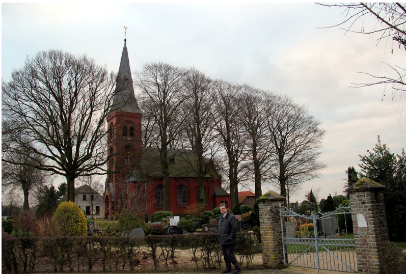
Kirche von Neulouisendorf bei Kalkar mit dem Friedhof im Vordergrund (2013)