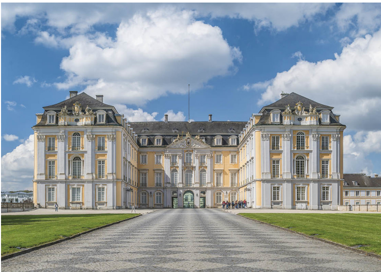
Schloss Augustusburg in Brühl (2019)