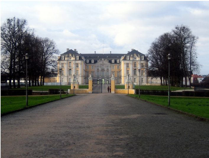
Schloss Augustusburg, Brühl (2011)