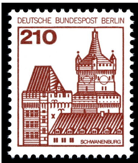
Schematische Darstellung der Schwanenburg Kleve auf einer Briefmarke der Dauermarkenserie "Burgen und Schlösser" der Deutschen Bundespost Berlin von 1979.