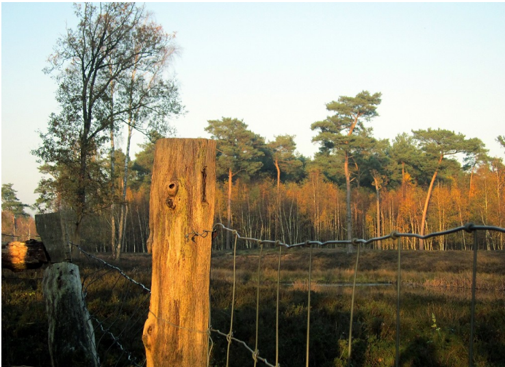
Heidelandschaft und Wald in der Dingener Heide bei Hamminkeln im Kreis Wesel (2011).