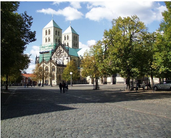
Der Domplatz in Münster