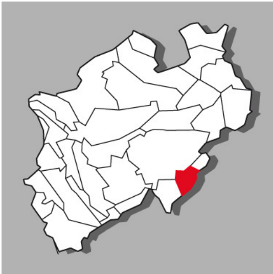
Lage der Kulturlandschaft Wittgenstein in Nordrhein-Westfalen