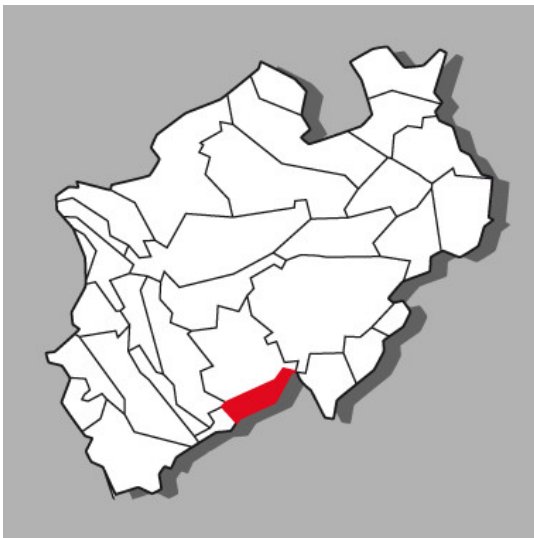
Lage der Kulturlandschaft Nutscheid-Sieg in Nordrhein-Westfalen

Bundesland: Nordrhein-Westfalen, Rheinland-Pfalz