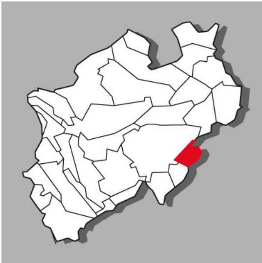
Lage der Kulturlandschaft Medebacher Bucht in Nordrhein-Westfalen