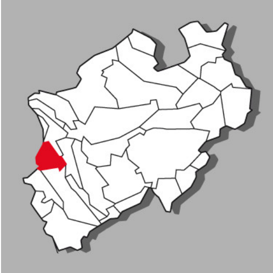
Lage der Kulturlandschaft Schwalm-Nette in Nordrhein-Westfalen