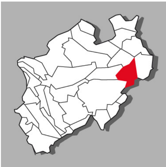
Lage der Kulturlandschaft Paderborner Hochfläche - Mittleres Diemeltal in Nordrhein-Westfalen