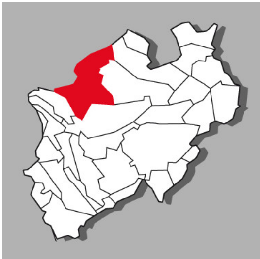
Lage der Kulturlandschaft Westmünsterland in Nordrhein-Westfalen

Bundesland: Niedersachsen, Nordrhein-Westfalen