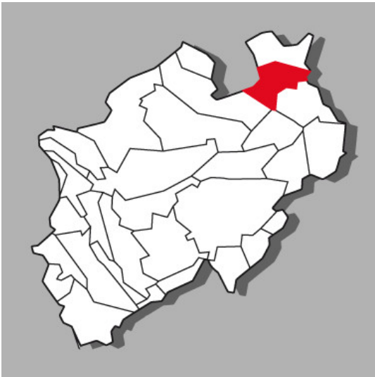
Lage der Kulturlandschaft Ravensberger Land in Nordrhein-Westfalen

Bundesland: Niedersachsen, Nordrhein-Westfalen