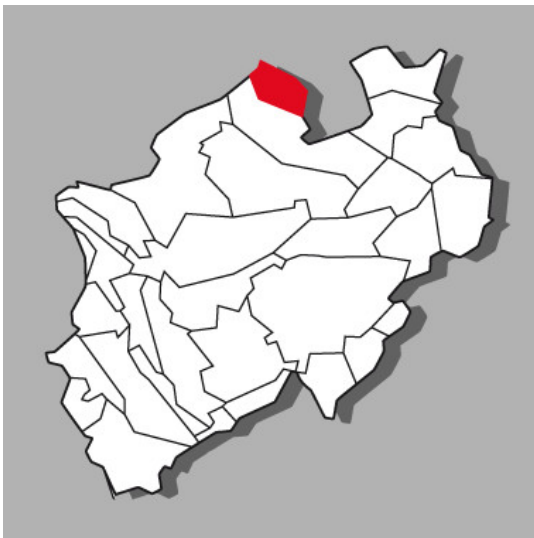
Lage der Kulturlandschaft Tecklenburger Land in Nordrhein-Westfalen

Bundesland: Niedersachsen , Nordrhein-Westfalen