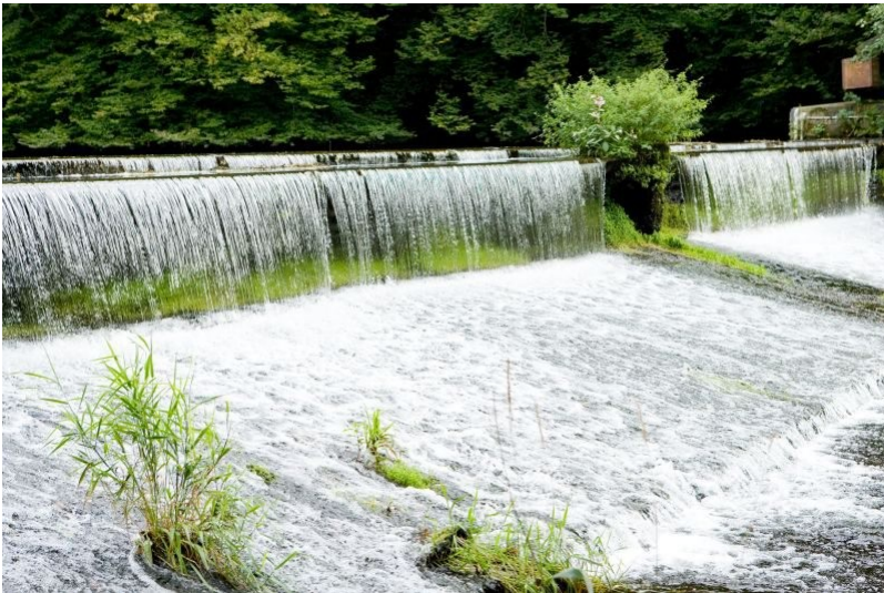
Das Wehr des Industriemuseums Wülfing in Dahlerau (2011)