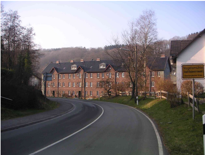
Dreigeschossige Wohnhäuserzeile aus Backstein in Vogelsmühle (2008)