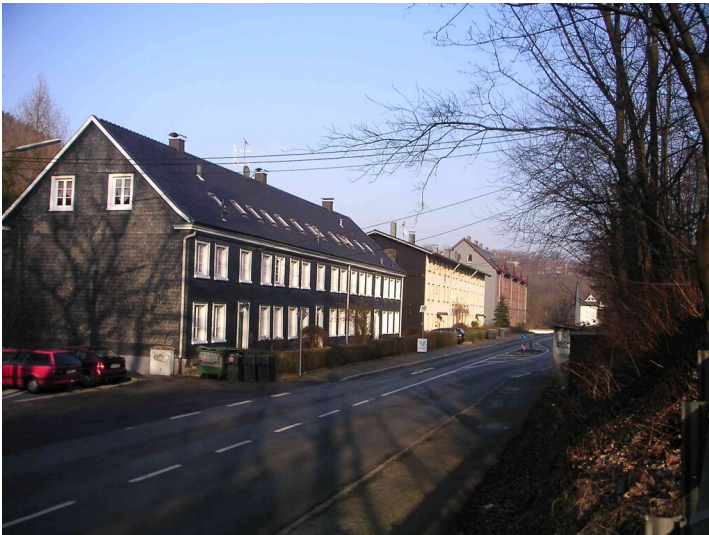
Denkmalgeschützte Wohnhäuser in der Wuppertalstraße in Vogelsmühle (2008)