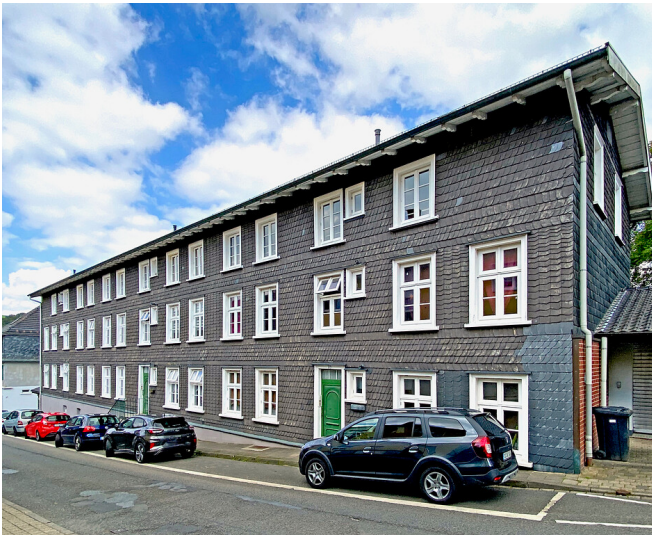
Arbeiterwohnhaus Keilbeckerstraße 15/17 in Keilbeck (2021)