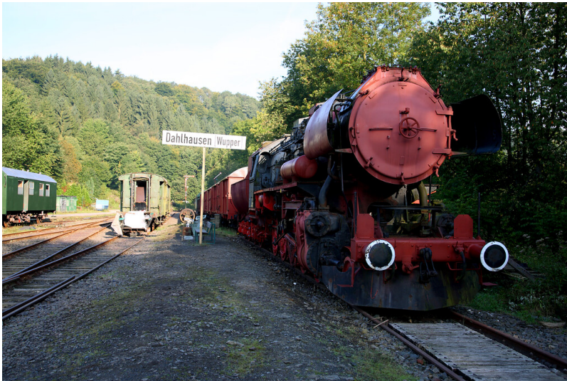
Denkmalgeschützte Dampflokomotive im Bahnhof von Dahlhausen (2008)