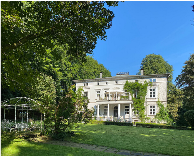
Fabrikantenvilla Hardt in Radevormwald-Dahlhausen (2021)