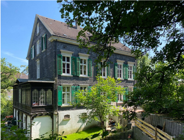
Wohnhaus Hardstraße 33 in Dahlhausen (2021)