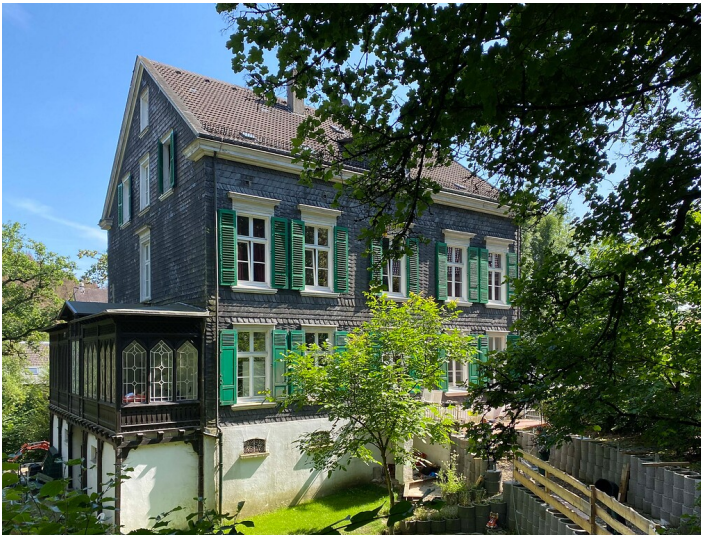
Wohnhaus Hardstraße 33 in Dahlhausen (2021)