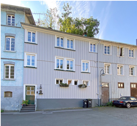
Konsumgebäude Wupperstraße 7 in Dahlerau (2021)