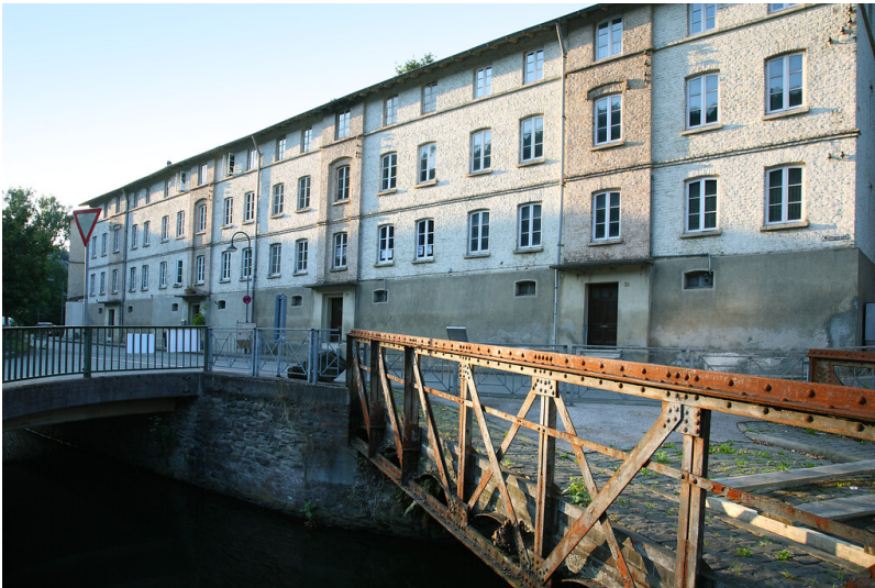
Arbeiterwohnhäuser in der Wülfingstraße 25-32 in Dahlerau (2008)