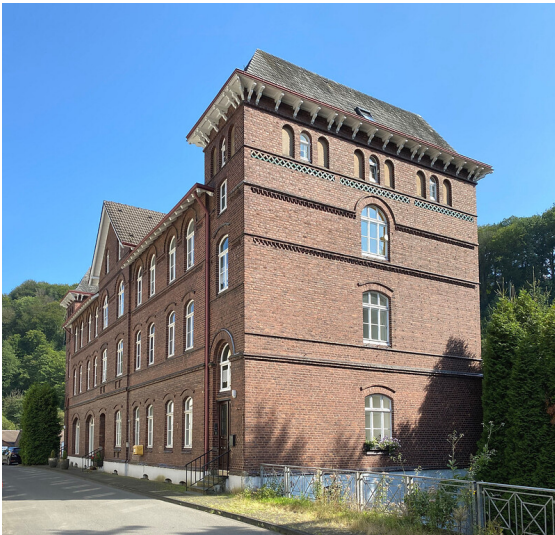
Arbeiterwohnhaus Wülfingstraße 2-4 in Dahlerau (2021)