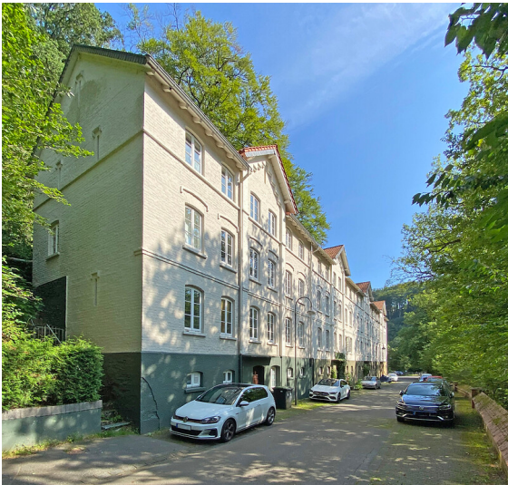
Arbeiterwohnhaus Wülfingstraße 1-7 in Dahlerau (2021)