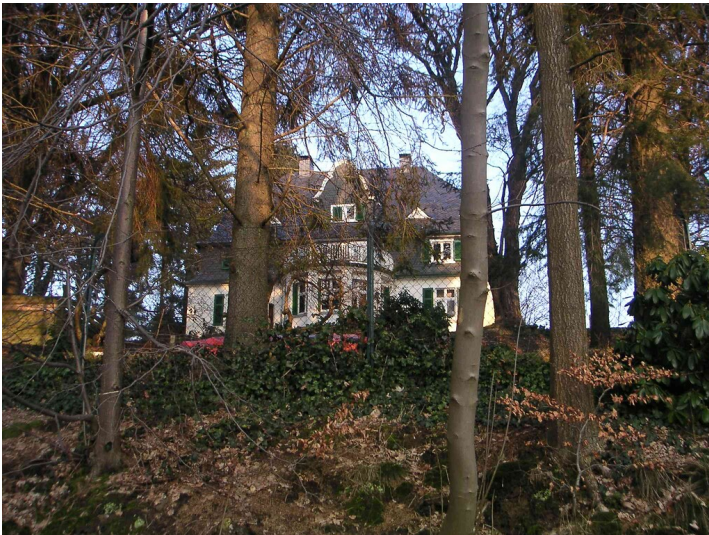
Direktorenvilla Vogelsmühle in Radevormwald-Keilbeck (2008)