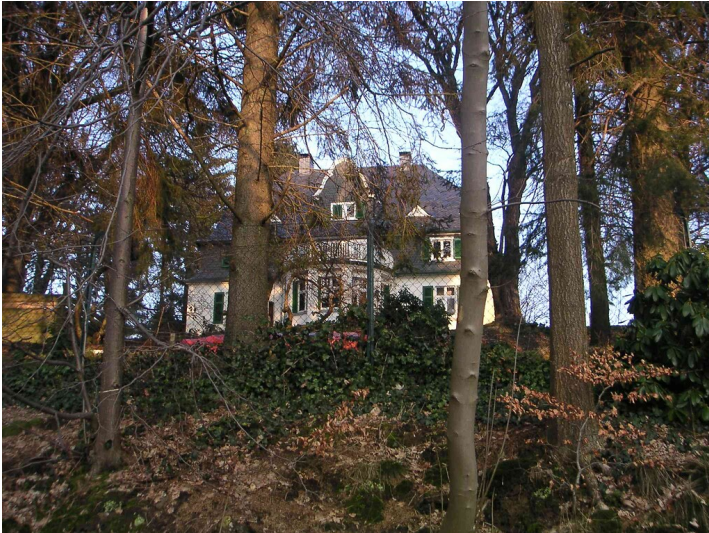
Direktorenvilla Vogelsmühle in Radevormwald-Keilbeck (2008)