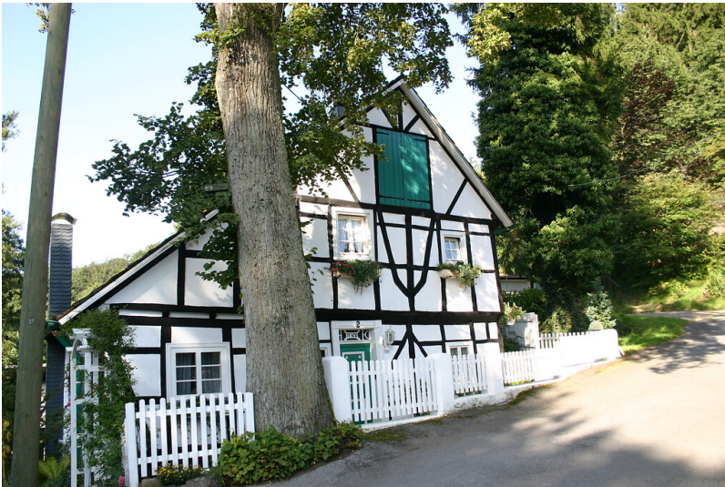
Fachwerkgebäude in Kaffeekanne (2008)